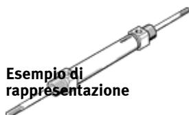
Esempio di rappresentazione