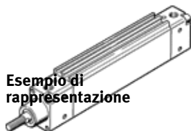
Esempio di rappresentazione

Antirotativo, per rilevamento posizioni, con ammortizzazione regolabile da entrambi i lati. Diverse possibilità di montaggio, con e senza elementi di fissaggio aggiuntivi.