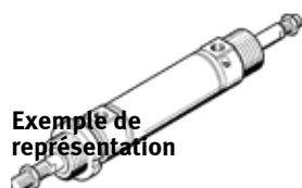
Exemple de représentation