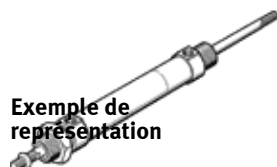
Exemple de représentation