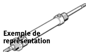
Exemple de représentation