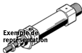
Exemple de représentation