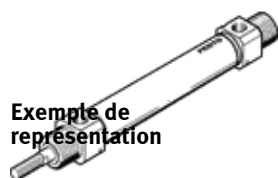
Exemple de représentation

Culasse arrière avec axe fileté, à tige (de piston) carrée. Ce produit est exclusivement disponible via la société Festo Corée