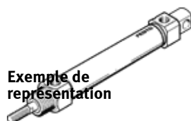
Exemple de représentation

Modèle en fin de vie. Disponible jusqu'en 2024. Voir le portail Support & Téléchargements pour des produits de remplacement.