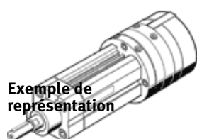
Exemple de représentation