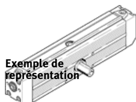
Exemple de représentation

Modèle en fin de vie. Disponible jusqu'en 2017. Voir le portail Support & Téléchargements pour des produits de remplacement.