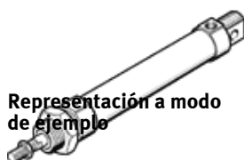
Representación a modo de ejemplo