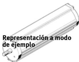
Representación a modo de ejemplo