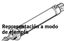
Representación a modo de ejemplo